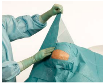
2 ... et enfin les champs formant les côtés du carré.