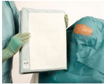
3 Tournez le champ équipé de la poche de recueil dans la bonne position (voir pictogramme).