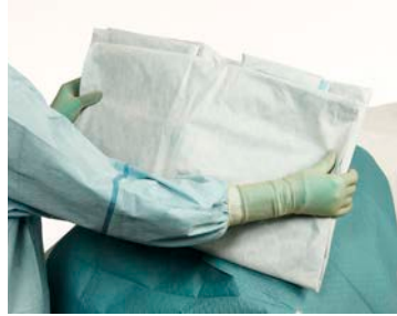
6 Dépliez d'abord les flancs...