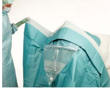
7 ... avant d'ouvrir le champ vers le bas.