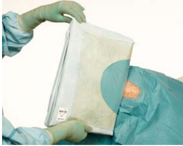
5 Veillez à ce que le drapage soit centré sur le champ opératoire.