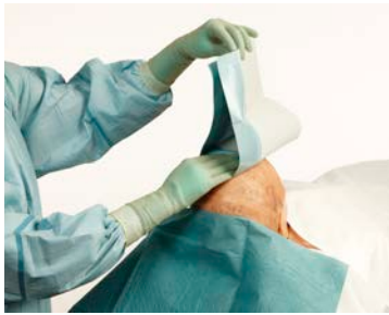
1 Formez un carré avec les champs adhésifs. Posez le champ supérieur, puis la partie inférieure...