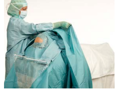
8 Tirez ensuite le champ vers les pieds du patient.