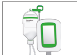
3. Hängen Sie die Flasche an den Tragegriff der Aufhängevorrichtung.