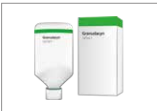
1. Nehmen Sie die NPWT-Flasche aus der Verpackung.

Granudacyn® kann zur Instillation mit NPWT (Unterdruck-Wundtherapie) verwendet werden.