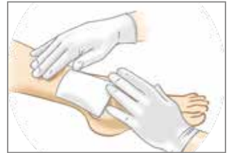
2. Geeignet zur Kombination mit Standard-Wundauflagen.

Granudacyn® kann zur Instillation mit NPWT (Unterdruck-Wundtherapie) verwendet werden.