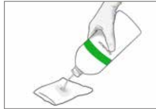
1C. Alternativ satt getränkte Komresse/n mit Granudacyn Wundspüllösung auf die Wunde auflegen und nach Bedarf einwirken lassen.