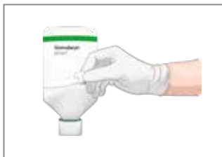
2. Lösen Sie den Tragegriff vom Etikett und stechen Sie die Flasche an.